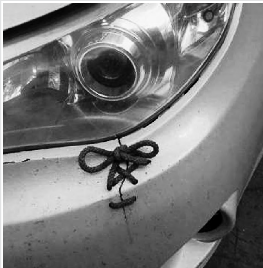
Наконец-то как новенькая!

- Рабинович, зачем в столовой вы заказываете две половинки борща, а потом их сливаете в одну тарелку. Не проще ли делать как все – заказывать полный борщ? - Сема, вы не понимаете. Так у меня получается одна порция борща с двумя порциями сметаны.