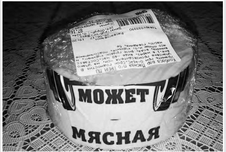
Это не точно, сильно не обольщайтесь